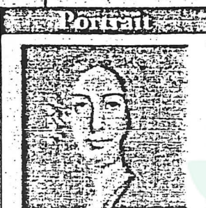
George Sand (1804/1876) est une romancière française du 19 e siècle. Elle a été aimée par le poète A. de Musset et le musicien F. Chopin. Elle revendiquait pour les femmes le droit à la passion.