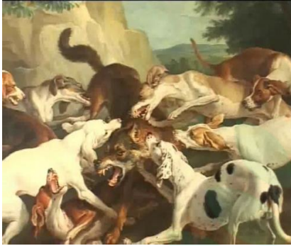
François Desportes, Chasse au loup .

Ils peuvent être dressés à des méthodes de chasse diverses, en fonction leurs aptitudes naturelles, du terrain et du type de gibier : on distingue ainsi les chiens d'arrêt (qui s'immobilisent lorsqu'ils ont repéré le gibier), les chiens leveurs de gibier et broussailleurs (dressés à débusquer les proies), les rapporteurs de gibier (qui cherchent et rapportent l'animal abattu à leur maître), les chiens d'eau (qui rapportent les oiseaux tombés dans l'eau), les chiens courants (qui poursuivent le gibier), les chiens de recherche au sang (qui pistent le gibier blessé).